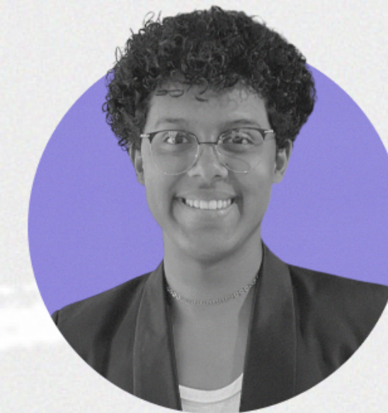
Editor de Vídeos