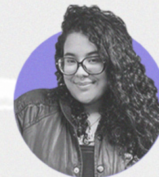
Gerente de cuenta